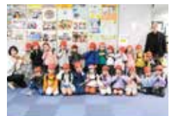
聖隷こども園 こうのとり富丘

編集後記 出会いと感謝が芽吹く、やさしい春になりますように(健正) 昨年食べたラーメンの杯数をカウントしたら122杯でした。 今年こそダイエットを…。(神谷)