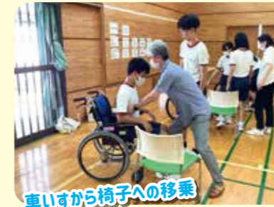
車いすから椅子への移乗