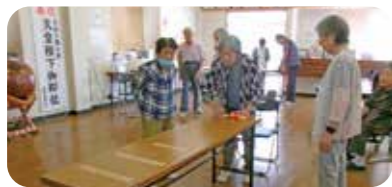
井戸端会議の集まりです。