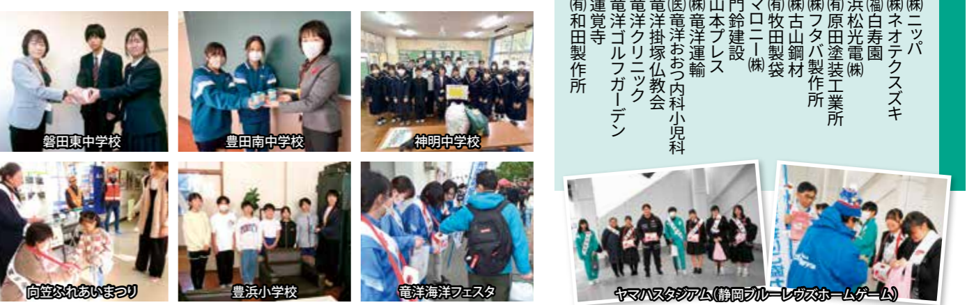
この他多くの匿名事業所・個人の方々に、ご協力いただきました。ありがとうございました。