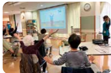
どなたでもお気軽にご参加できます。 “健康”についてみんなで話し合ったり、 楽しく体を動かしてみませんか？

会場 リハケアーズ福田 日時 毎月第3土曜日 9時30分～11時 13時30分～15時