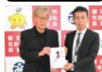
いわた信用金庫店別対抗チャリティゴルフ大会