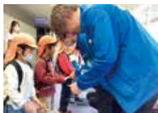
こうのとり保育園