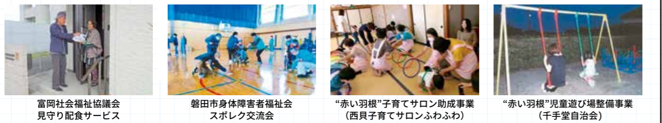
富岡社会福祉協議会 見守り配食サービス | 磐田市身体障害者福祉会 スポレク交流会 | “赤い羽根”子育てサロン助成事業 (西貝子育てサロンふわふわ) | “赤い羽根”児童遊び場整備事業 (千手堂自治会)