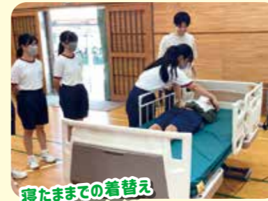
履たままでの着替え

今年度からの新たな取り組みとして、市内社会福祉法人・福祉用具取り扱い業者・社協で協働して介護・介助の体験学習を実施しています！ 従来の介護・介助体験というと、生徒が施設に出向いて体験することが多かったですが、この講座では、中学校に各種福祉用具を持ち込み、福祉施設職員が福祉のお仕事について生徒に伝えています。生徒はそれぞれ5つのブースを回り、学びを深めていきます。福祉施設へ見学に行く前段階の学習として、ご活用いただきました。 次年度も、希望される中学校があれば、継続して実施します。