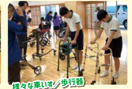
様々な車いす/歩行器