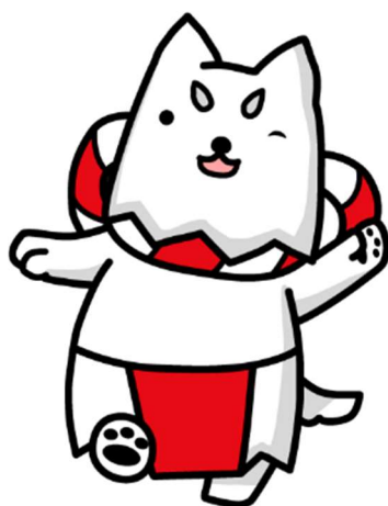
磐田市イメージキャラクター