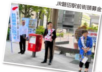
JR磐田駅前街頭募金