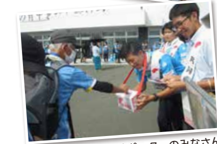
ジュビロサポーターのみなさん ありがとうございました!