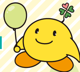
磐田市社会福祉協議会 マスコット キャラクター ふくびー