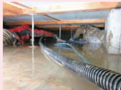
床下に潜り、泥などを特殊な掃除機で吸引