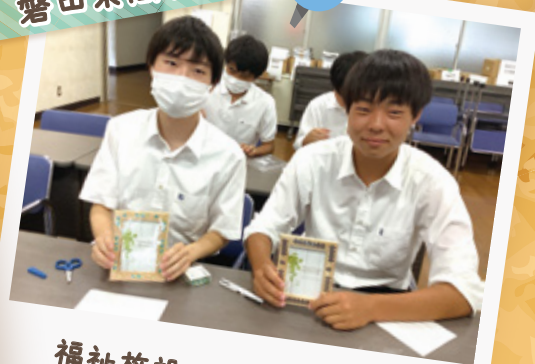
福祉施設へ贈る写真立て作り