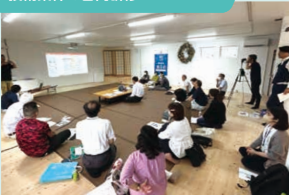
今後同様の災害が起きた場合を想定して、災害ボランティアコーディネーターとNPO法人大工村が技術案件の研修を受講