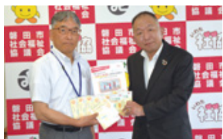
第一生命保険(株)磐田営業オフィス