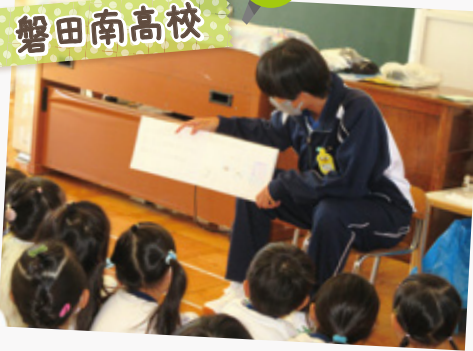
オリジナル絵本の読み聞かせ