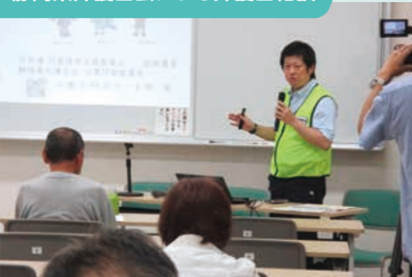
被害にあわれた方に向けて、被災者支援制度の説明や個別相談会を開催