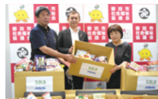
サーラ・ジュビロ フードドライブ