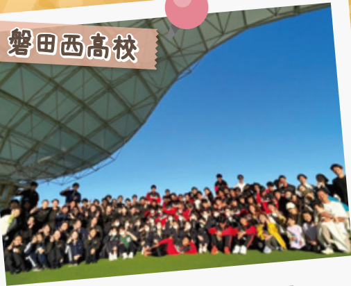
今之浦公園リバーサイドテラス ボランティア活動