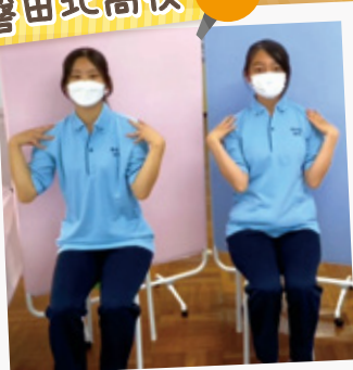
座ってできる体操レクチャー