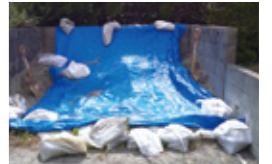
磐田市HP 家庭でできる簡易水防工法