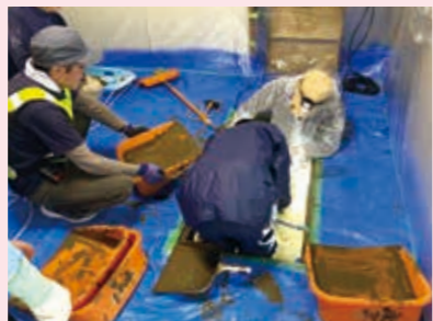
“てみ”など道具を使って床下の泥だし