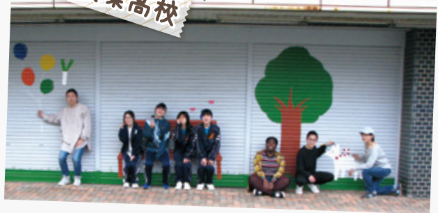
ビジュアルアート部によるシャッターアートプロジェクト