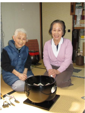
【話し相手】お茶で使用する風炉灰づくりを習ったんです