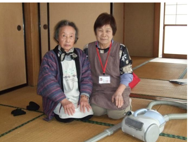
「ひとり暮らしなので助かります」