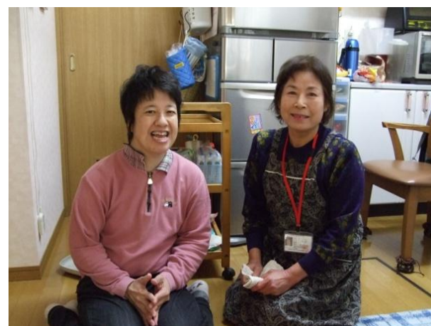
「高い所の作業が大変です」