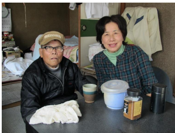
作業をした後のコーヒータイム