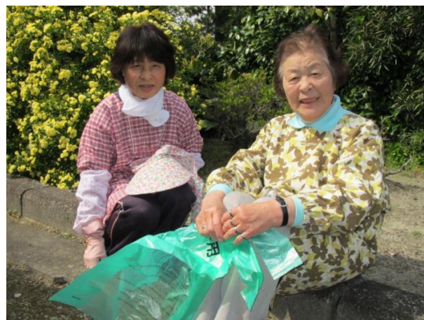
うちの猫も支援員さんを待ってます