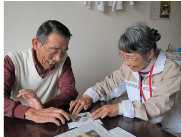
「おつりの確認をしてください」